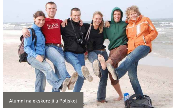
Alumni na ekskurziji u Poljskoj

U toku trajanja stipendije diplomci rade na pronalaženju rešenja aktuelnih problema zaštite životne sredine. Nakon boravka u Nemačkoj Alumni su bolje pripremljeni za rešavanje sličnih problema u svojoj zemlji, na ovaj način osiguravajući transfer znanja u matičnu zemlju. Putem međunarodne saradnje se uklanjaju postojeće barijere i uspostavljaju novi kontakti, gradeći snažnu mrežu posvećenih stručnjaka za zaštitu životne sredine.