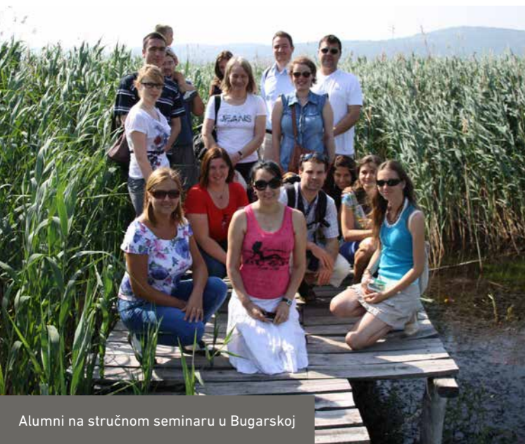
Alumni na stručnom seminaru u Bugarskoj

Stipendija počinje uvodnim seminarom za sve nove stipendiste u Oznabriku, gde se razjašnjavaju važna organizaciona pitanja vezana za boravak u Nemačkoj. Nakon toga sledi intenzivni kurs nemačkog jezika koji traje nekoliko sedmica i odvija se u takođe u Oznabriku. DBU prati, pruža podršku i nadgleda stipendiste tokom celog perioda stipendiranja. Na seminarima stipendisti prezentuju svoje teme i rezultate i imaju priliku za međusobno povezivanje i umrežavanje. Sopstvena inicijativa u organizaciji dodatnih stručnih seminara, okupljanja, i sastanaka je veoma dobrodošla i podržana od strane DBU-a.