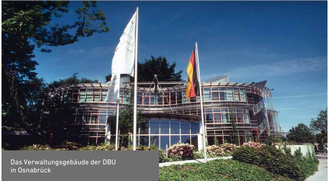
Das Verwaltungsgebäude der DBU in Osnabrück