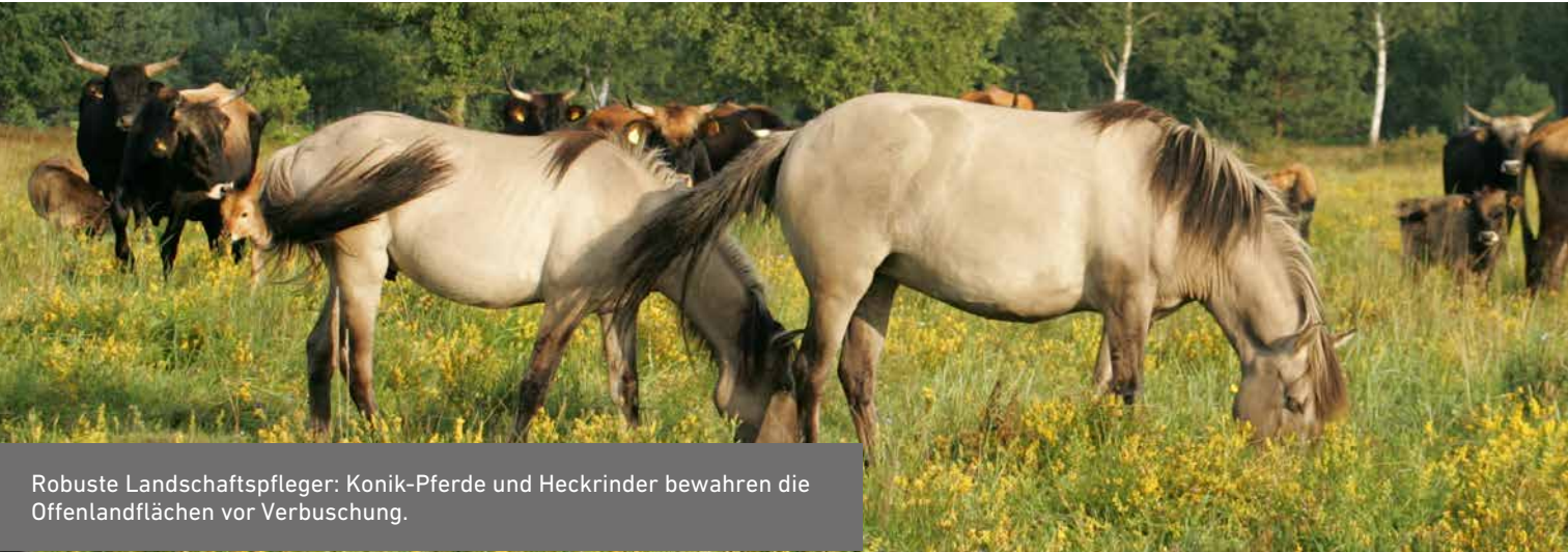
Robuste Landschaftspfleger: Konik-Pferde und Heckrinder bewahren die Offenlandflächen vor Verbuschung.