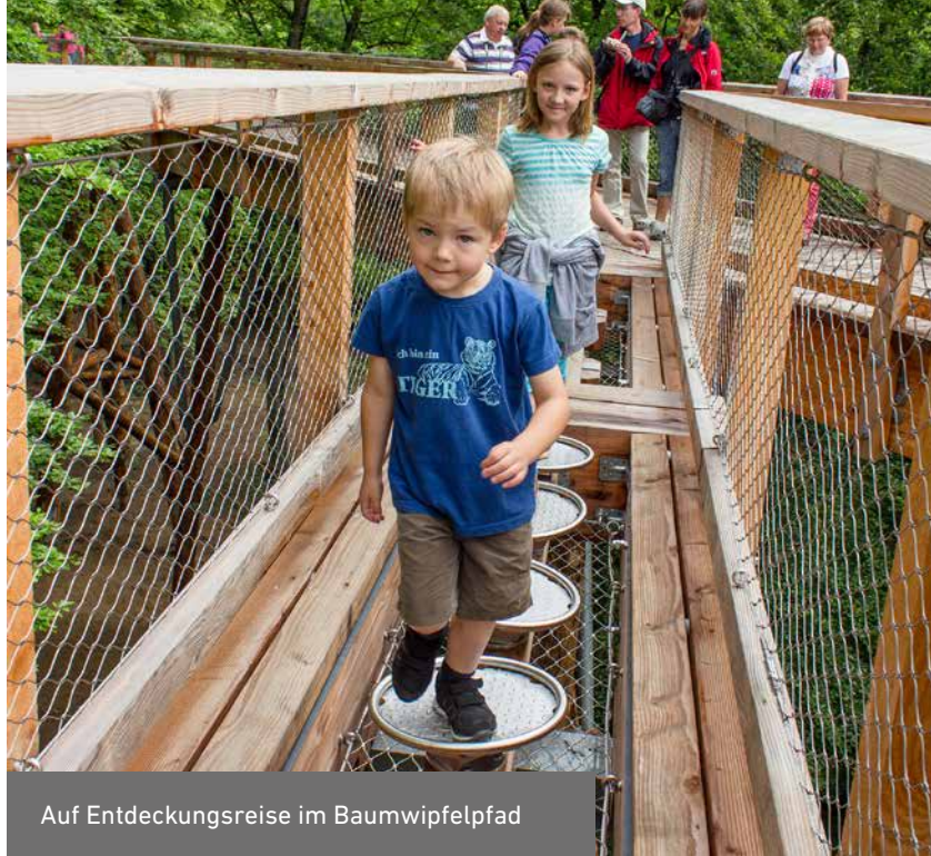
Auf Entdeckungsreise im Baumwipfelpfad

Eine besonders beeindruckende Kombination von Naturerleben und Naturerfahren wird bereits auf einigen DBU-Naturerbeflächen angeboten. Mitten auf der DBU-Naturerbefläche Prora auf Rügen in Mecklenburg-Vorpommern befindet sich das Naturerbe Zentrum RÜGEN mit Erlebnisausstellungen und einem 1250 Meter langen Baumwipfelpfad. Der Pfad führt 4 bis 17 Meter über dem Erdboden in Augenhöhe an den mächtigen Baumkronen des Buchenmischwaldes vorbei und endet in einem 40 Meter hohen Aussichtsturm. Von dort bietet sich ein einzigartiger Blick über die Insel Rügen, die Boddenlandschaft und die Ostsee. Naturführer bieten Exkursionen in die Fläche an, und mit etwas Glück kann man den heimischen Seeadler beobachten.