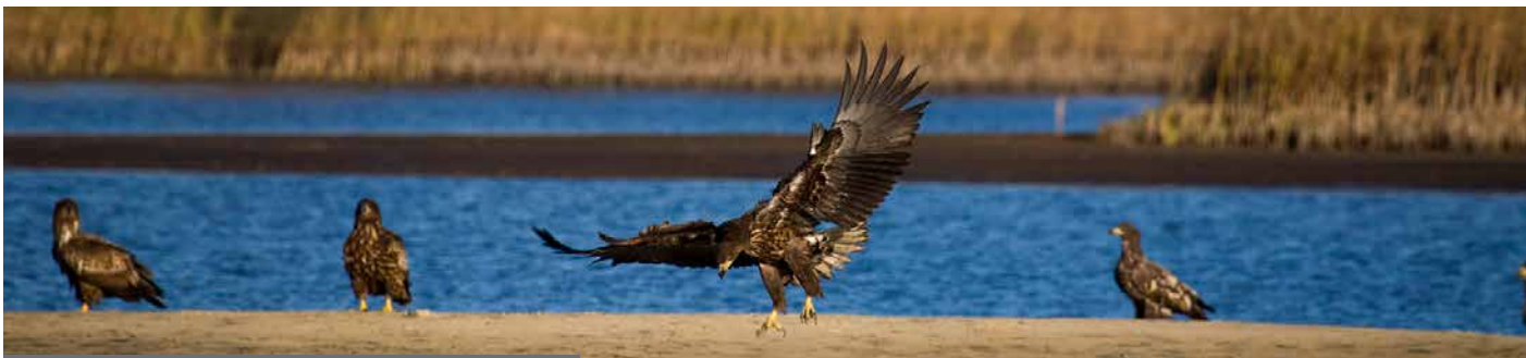
Der Seeadler ( Haliaeetus albicilla ) ist an gewässerreiche Landschaften gebunden.

Das Charakteristische von Küstengewässern ist die periodische Überflutung der Uferbereiche. Dadurch ist der Lebensraum von einer großen Dynamik geprägt. Auf den DBU-Naturerbeflächen Elbwiesen Ostemündung in Niedersachsen wurden von Kooperationspartnern der DBU Naturerbe GmbH, dem Niedersächsischen Landesbetrieb für Wasserwirtschaft, Küsten- und Naturschutz (NLWKN) sowie den Landkreisen Cuxhaven und Stade, Priele reaktiviert und neu gegraben. Das Wasser der Unterelbe dringt so wieder mit den Gezeiten in das Marschland ein.