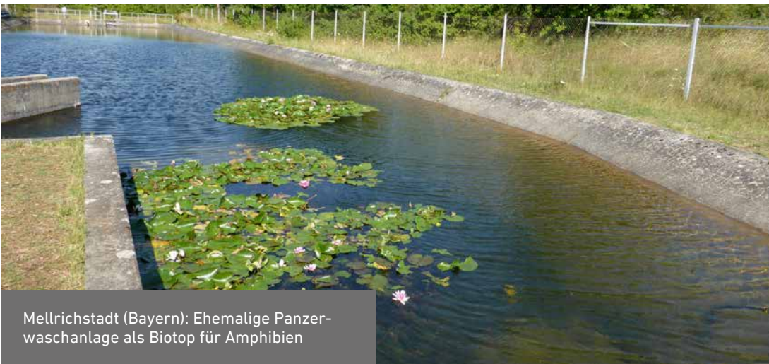
Mellrichstadt (Bayern): Ehemalige Panzerwaschanlage als Biotop für Amphibien

Als weitere Relikte einer früheren Nutzung befinden sich auf den Flächen zudem Gebäude. Kasernen, Panzerwaschanlagen, Bunker oder ehemalige Heeresmunitionsanstalten werden – wenn der Denkmalschutz es erlaubt – entweder abgerissen oder als Lebensräume für Fledermäuse oder Amphibien optimiert und erhalten. Auf der DBU-Naturerbefläche Peenemünde in Mecklenburg-Vorpommern werden nicht nur Naturschutzziele umgesetzt, sondern es wird auch der Denkmalschutz gleichrangig berücksichtigt. Die umfangreichen Reste der ehemaligen Heeresversuchsanstalt Peenemünde aus dem Zweiten Weltkrieg sowie Gebäude aus den Zeiten der Nationalen Volksarmee sollen als größtes technisches Denkmal des Landes erhalten bleiben.