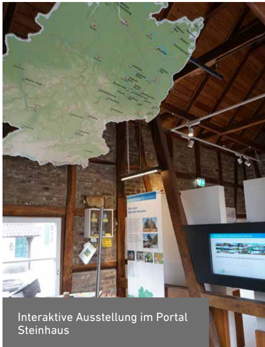
Interaktive Ausstellung im Portal Steinhaus

Vier Portale führen in das Gebiet Wahner Heide/Königsforst in Nordrhein-Westfalen: im Norden das Forsthaus Steinhaus in Bergisch-Gladbach, im Süden die Burg Wissem in Troisdorf, im Osten der Turmhof in Rösrath und im Westen das Gut Leidenhausen in Köln-Porz. Jedes Portal zeigt eine Ausstellung zur Wahner Heide, die sich mit einem anderen Schwerpunktthema befasst. Darüber hinaus bieten sie verschiedene Umweltbildungsangebote sowie Räumlichkeiten für Veranstaltungen.