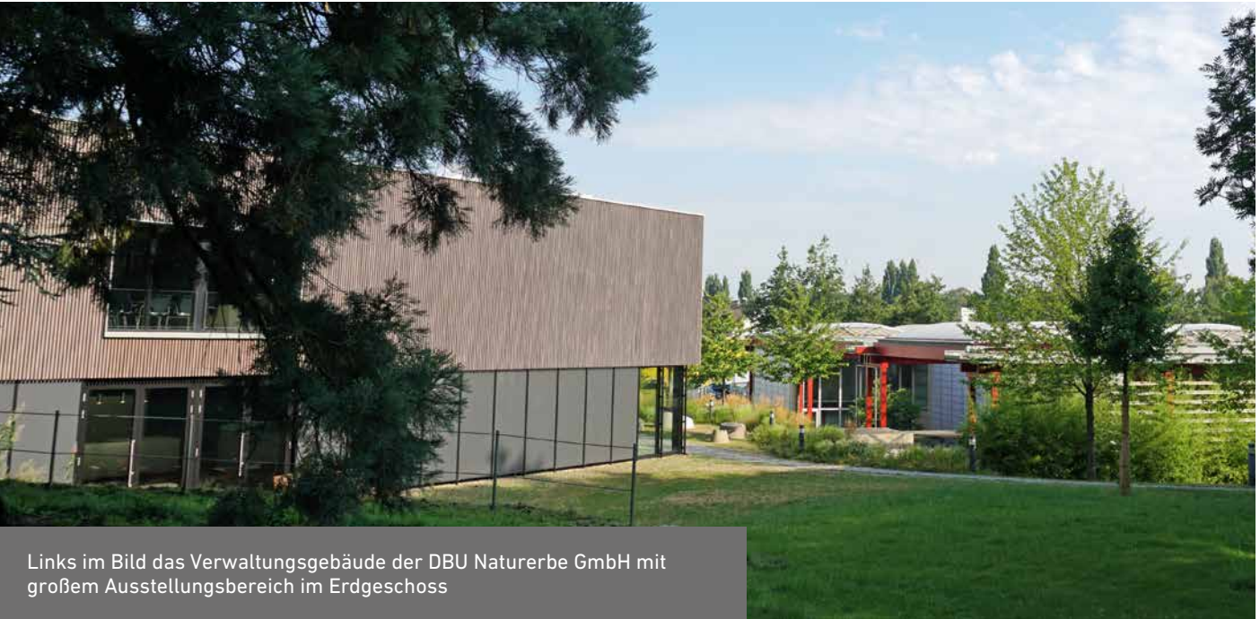
Links im Bild das Verwaltungsgebäude der DBU Naturerbe GmbH mit großem Ausstellungsbereich im Erdgeschoss