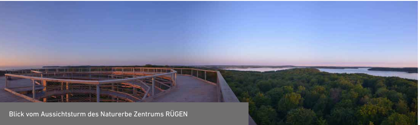
Blick vom Aussichtsturm des Naturerbe Zentrums RÜGEN