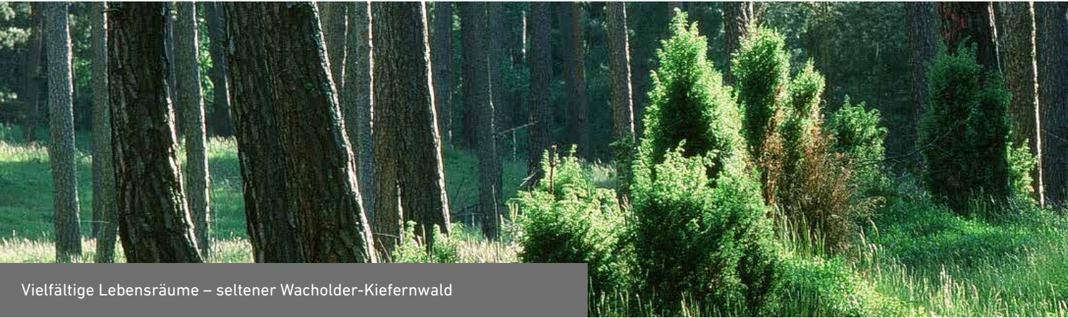
Vielfältige Lebensräume – seltener Wacholder-Kiefernwald