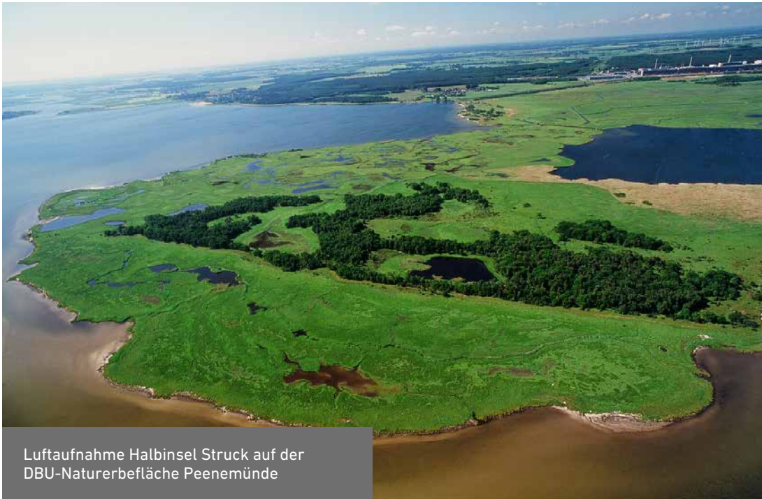
Luftaufnahme Halbinsel Struck auf der DBU-Naturerbefläche Peenemünde

Deutschland trägt für seine vielfältigen Landschaften, sein Nationales Naturerbe, eine besondere Verantwortung. Um dieses Erbe zu bewahren, übergibt die Bundesregierung bis zu 156 000 Hektar national bedeutsame Flächen an die Länder, die DBU Naturerbe GmbH und Naturschutzverbände – eine einmalige Chance für den Naturschutz.