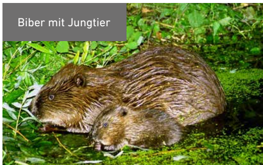
Biber mit Jungtier

Biber ( Castor fiber ) leben in Gewässernähe. Wie kaum eine andere Tierart gestaltet der Biber seinen Lebensraum: Er fällt Bäume, baut Burgen und Staudämme. Damit schafft er neue Lebensräume für andere Tier- und Pflanzenarten und fördert die biologische Vielfalt. Die Schneidezähne sind zu starken Meißeln entwickelt und in Anpassung an das Leben im Wasser sind die Zehen der Hinterfüße mit Schwimmhäuten verbunden.