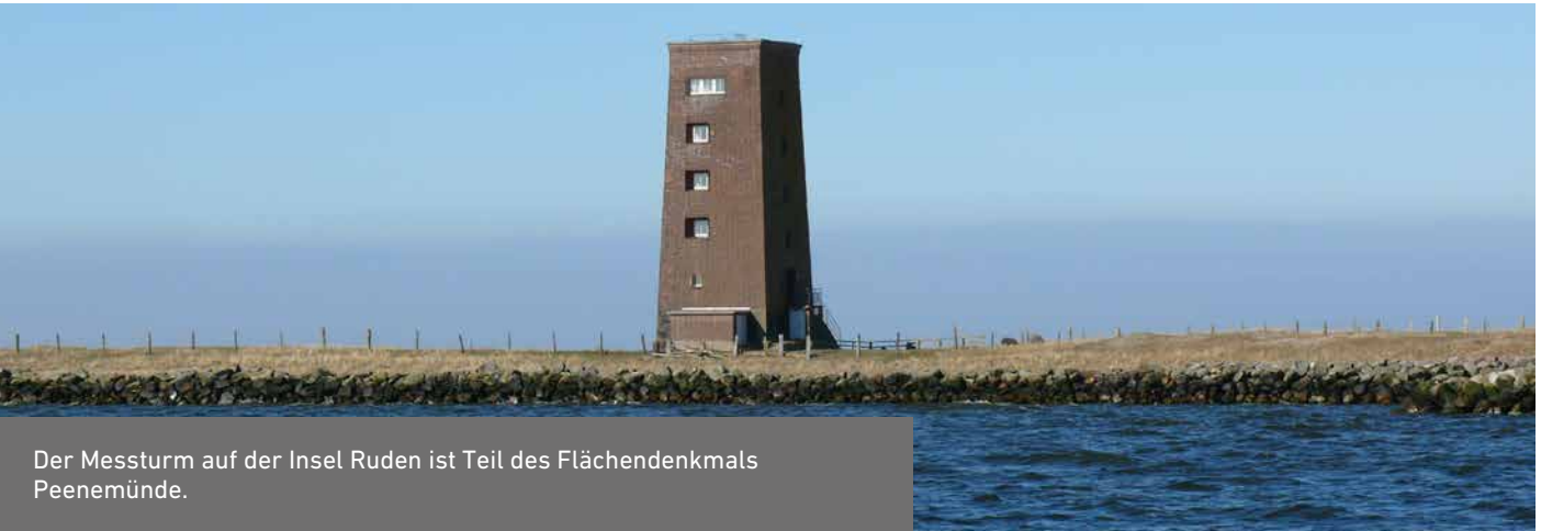
Der Messturm auf der Insel Ruden ist Teil des Flächendenkmals Peenemünde.

Mit Ausnahme des Feuchtwiesenkomplexes Elbwiesen Ostemündung in Niedersachsen und des Moorgebietes Göldenitzer Moor in Mecklenburg-Vorpommern sind alle DBU-Naturerbeflächen für verschieden lange Zeiträume auf unterschiedliche Art militärisch genutzt worden. Die Wahner Heide in Nordrhein-Westfalen blickt auf eine sehr lange militärische Vorgeschichte zurück und wurde von 1817 bis 2002 fast durchgängig als Truppenübungsplatz genutzt. Schon die königlich-preußische Artillerie-Brigade führte Schießübungen durch, später wurde das Gelände regelmäßig von schweren Panzern der belgischen Streitkräfte befahren. Auch die Naturerbefläche auf dem Ebenberg bei Landau in Rheinland-Pfalz diente über hundert Jahre lang, von 1893 bis 1999, als militärisches Übungsgelände. Unter anderem testete man hier Handgranaten und in der Zeit des Kalten Krieges waren auf dem