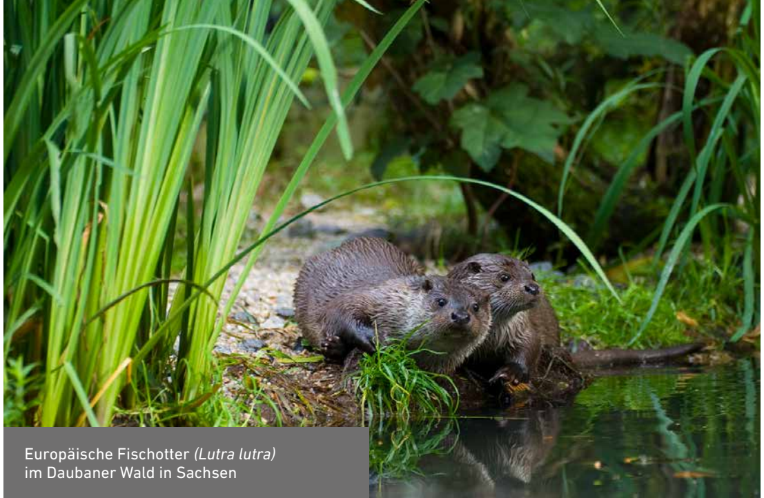
Europäische Fischotter ( Lutra lutra ) im Daubaner Wald in Sachsen