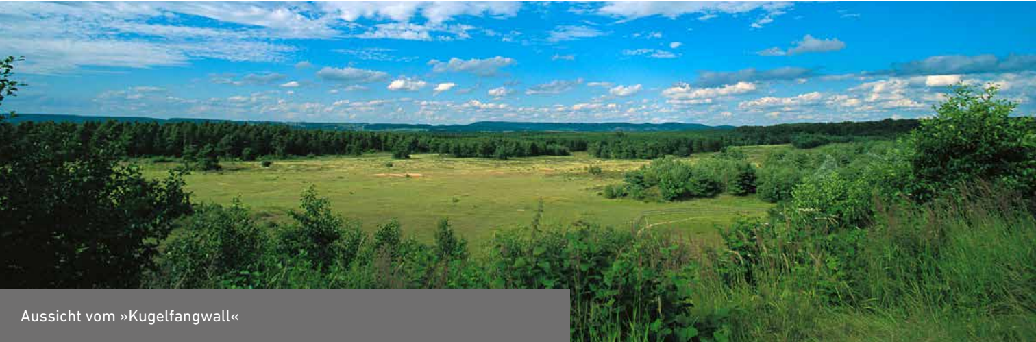
Aussicht vom »Kugelfangwall«