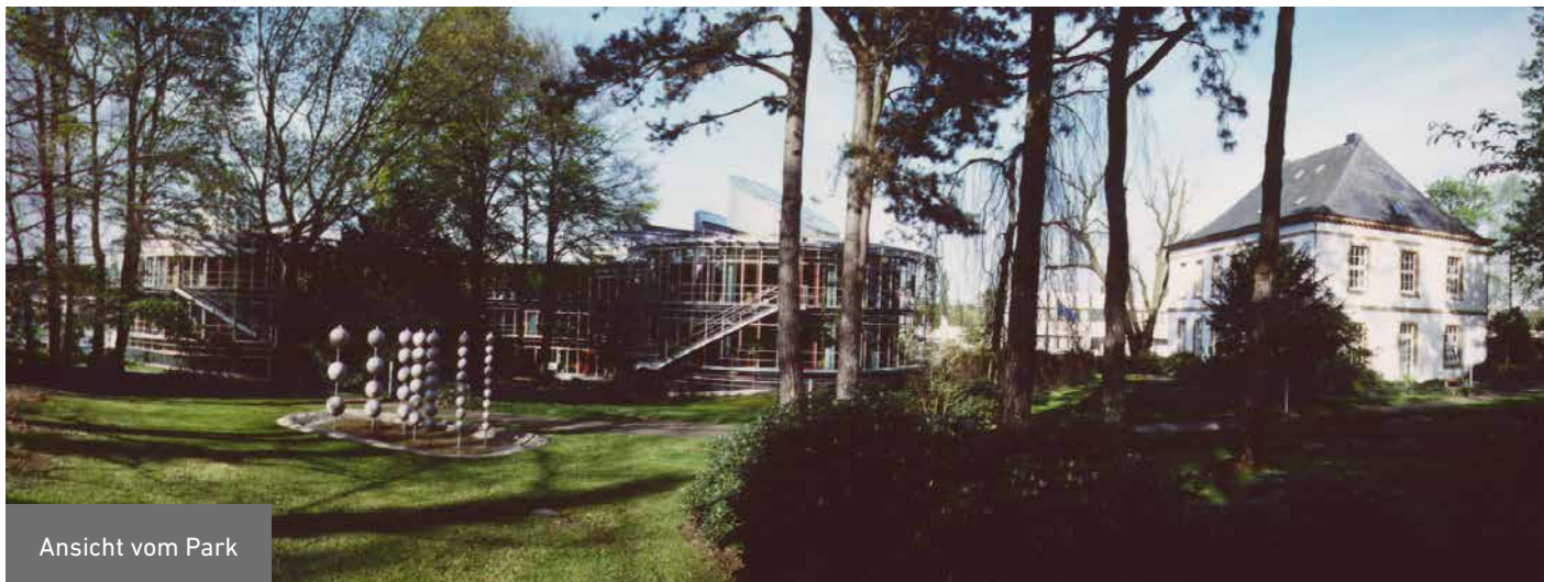
Ansicht vom Park

Aktuelle Informationen über Förderschwerpunkte und weitere Aktivitäten können über das Internet unter www.dbu.de abgerufen werden.