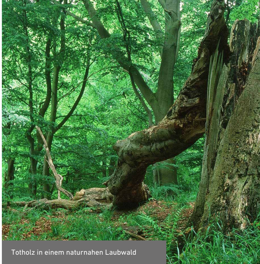
Totholz in einem naturnahen Laubwald

Flächen überlässt man schon heute oder zu einem späteren Zeitpunkt ihrer natürlichen Entwicklung und ermöglicht dadurch dynamische Prozesse. Hier lässt man »die Natur Natur« sein. Dieser sogenannte »Prozessschutz« wird in den Wäldern praktiziert. Aber nur mit dieser Strategie würde es nicht gelingen, ein möglichst hohes Maß an biologischer Vielfalt zu erhalten. Das gilt beispielsweise für offene Lebensräume, die als Kulturlandschaften vom Menschen gestaltet wurden und einen großen Teil der Artenvielfalt in unserem dicht besiedelten Land beherbergen. Bei den Offenlandlebensräumen findet der »konservierende« Naturschutz Anwendung. Diese Lebensräume können nur durch pflegende Eingriffe erhalten bleiben. Durch Beweidung oder Mahd wird eine Verbuschung verhindert, sodass offene Lebensräume auch zukünftig Teil der Landschaft sind.