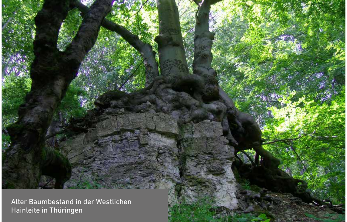
Alter Baumbestand in der Westlichen Hainleite in Thüringen